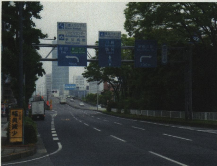
1 本件速度違反場所付近道路の状況（大豆戸町方向から撮影）