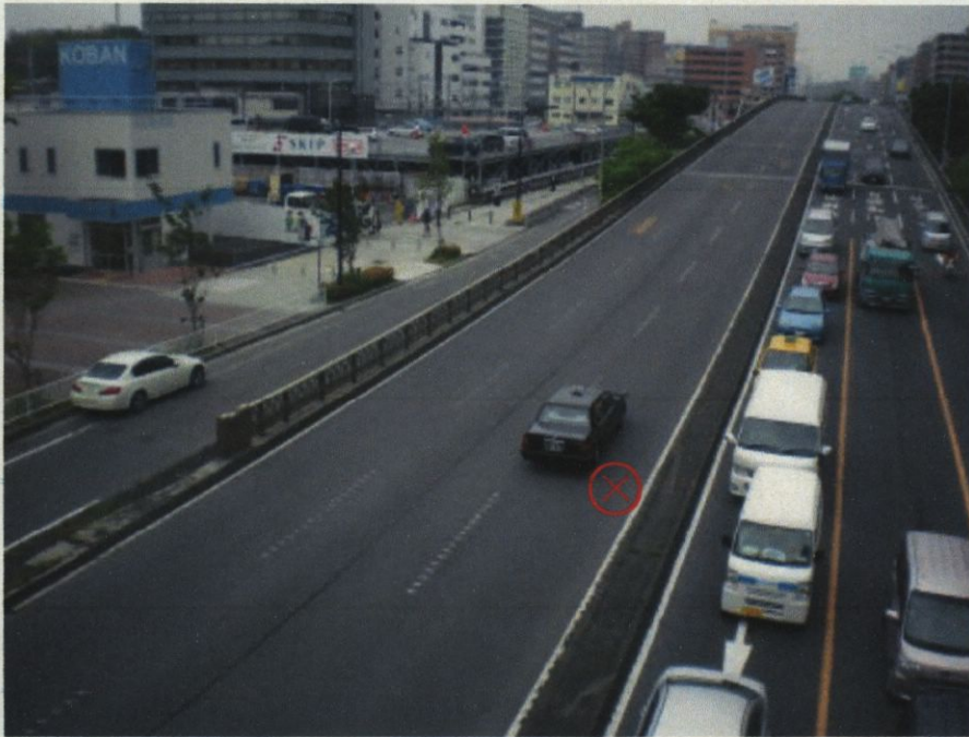
5 平成25年6月14日発生の交通死亡事故現場の状況（歩道橋上から撮影、写真上の⊗印は、交通死亡事故の発生地点）