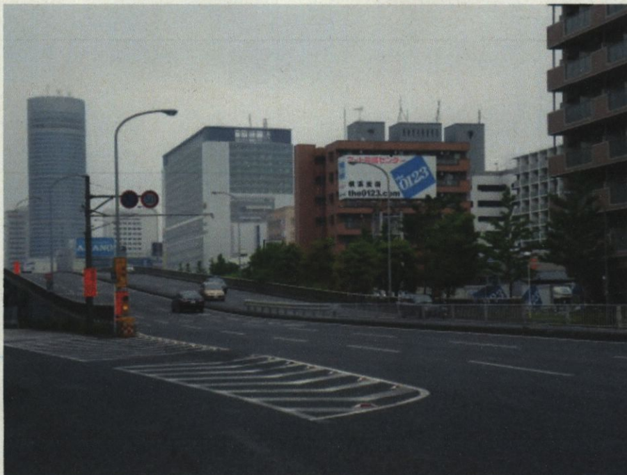
2 本件速度違反場所に設置された道路標識（オーバーハング標識）の設置状況