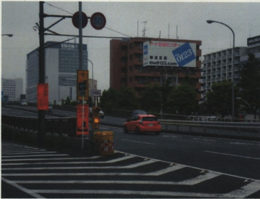
3 前葉同（最高速度50キロメートル毎時）