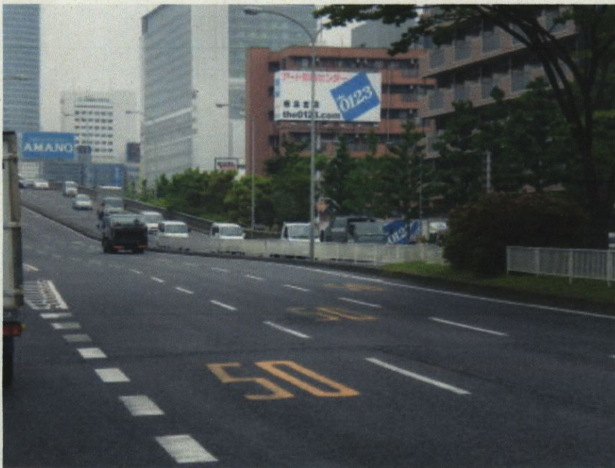
4 本件速度違反場所の路面に描かれた道路標示の状況